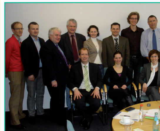
Treffen zum Auftakt der Projekts „Gesunde Kinder in gesunden Kommunen“

Mehr Sportunterricht an den Schulen in Kombination mit Vereinsangeboten am Nachmittag zu initiieren sowie weitere außerschulische Bewegungsanreize zu setzen, ist ein wesentlicher Baustein des EU-Projektes „Ready for Healthy Children in Sound Communities“. Gemeinsam mit der ENGSO Jugend (European Non-Governmental Sport Organisation)