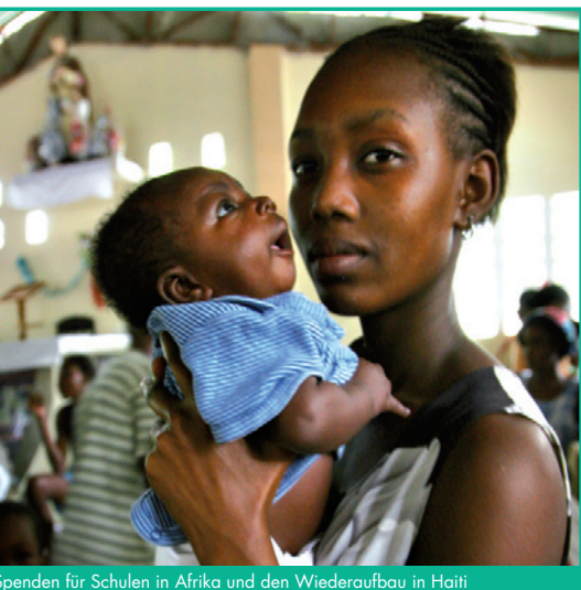
Spenden für Schulen in Afrika und den Wiederaufbau in Haiti

Weitere Infos: www.dsj.de und www.unicef.de/laufen