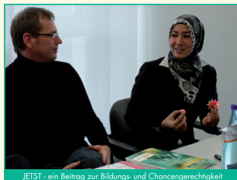
JETST - ein Beitrag zur Bildungs- und Chancengerechtigkeit

Weitere Informationen zum Projekt JETST finden Sie unter www.jetst.de .