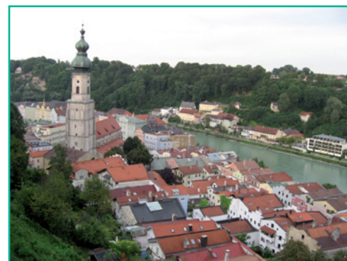
Burghausen hat nicht nur exzellente Sportstätten, sondern auch zahlreiche sportbegeisterte Einwohner/-innen

Weitere Infos: www.dsj-jugendevent.de E-Mail: jugendevent@dsj.de